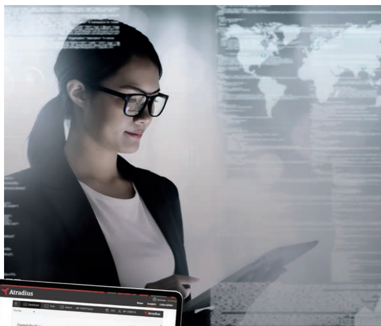
Atradius Atrium Atradius Insights